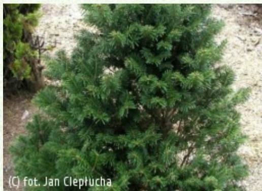
(C) fot. Jan Cieplucha

(c) fot. Jan Cieplucha CIEPŁUCHA Gospodarstwo Szkółkarskie