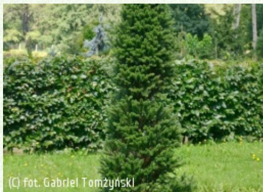
(C) fot. Gabriel Tomżyński (c) fot. Gabriel Tomżyński TOMŻYŃSKI Szkołka Roślin