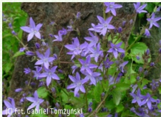
TOMZYNSKI Szkołka Roślin