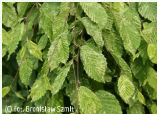
SZMIT Szkołka

Polska odmiana grabu sprzed 100 lat, o ładnym pokroju i pstrych liściach. Dorasta do kilku metrów wysokości i szerokości. Kształt korony półkulisty, parasolowaty. Pędy ułożone poziomo, końce pędów zwisające. Rośliny mają tendencje do samoistnego wypiętrzania się, ale w pierwszym okresie po posadzeniu lepiej prowadzić przewodnik przy podporze. Liście biało upstrzone, młode dość dekoracyjne; na starszych liściach przebarwienia mniej widoczne. Jesienią liście żółte. Nadaje się na stanowiska słoneczne i półcieniste. Roślina tolerancyjna, ale lepiej rośnie na glebach świeżych i żyznych. Odmiana kolekcyjna, polecana do małych ogrodów.