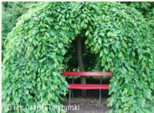
(c) fot. Gabriel Tomżyński (c) fot. Gabriel Tomżyński TOMŻYŃSKI Szkółka Roślin