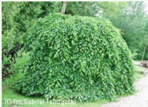
(c) fot. Gabriel Tomżyński (c) fot. Gabriel Tomżyński TOMŻYŃSKI Szkółka Roślin