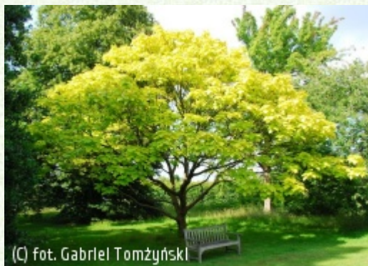
(C) fot. Gabriel Tomżyński (c) fot. Gabriel Tomżyński TOMŻYŃSKI Szkołka Roślin