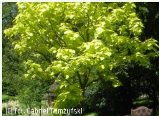
TOMŻYŃSKI Szkołka Roślin