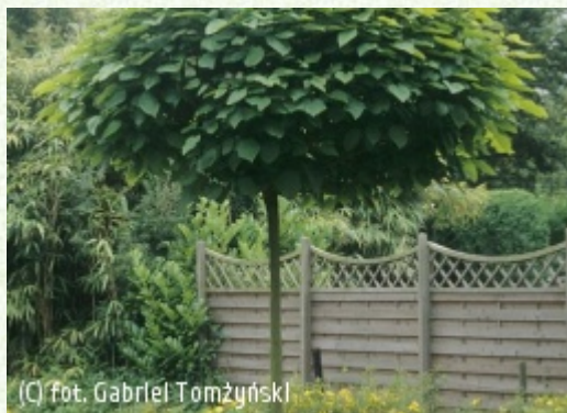
(c) fot. Gabriel Tomżyński (c) fot. Gabriel Tomżyński TOMŻYŃSKI Szkołka Roślin