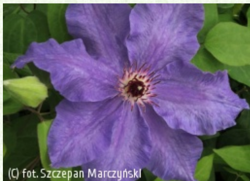
(c) fot. Szczepan Marczyński (c) fot. Szczepan Marczyński CLEMATIS Źródło Dobrych Pnączy Sp. z o.o. Spółka komandytowa

Grupa Early Large-flowered (incl. Patens, Fortunei & Florida)