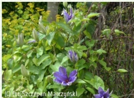
CLEMATIS Źródło Dobrych Pnączy Sp. z o.o. Spółka komandytowa