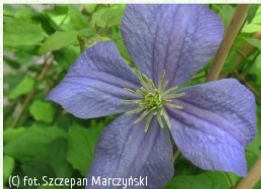
(c) fot. Szczepan Marczyński (c) fot. Szczepan Marczyński CLEMATIS Źródło Dobrych Pnączy Sp. z o.o. Spółka komandytowa