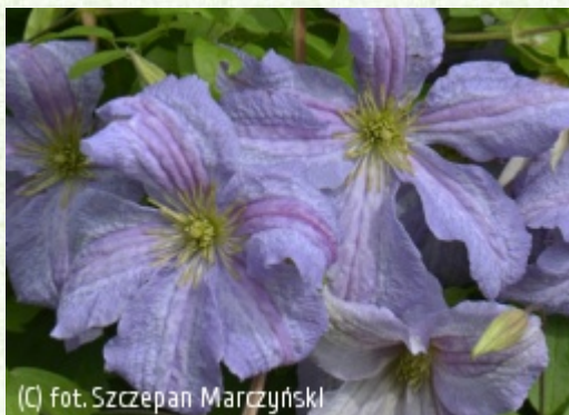
(c) fot. Szczepan Marczyński (c) fot. Szczepan Marczyński CLEMATIS Źródło Dobrych Pnączy Sp. z o.o. Spółka komandytowa