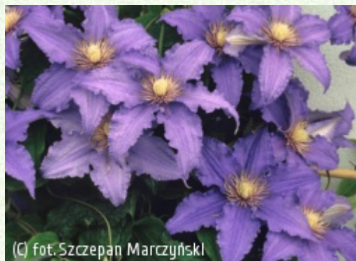
CLEMATIS Źródło Dobrych Pnączy Sp. z o.o. Spółka komandytowa