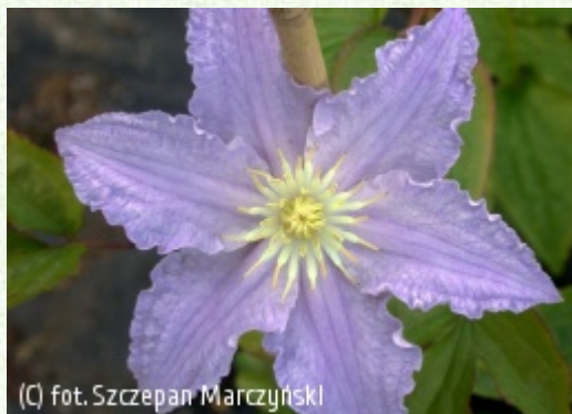
(C) fot. Szczepan Marczyński (c) fot. Szczepan Marczyński CLEMATIS Źródło Dobrych Pnączy Sp. z o.o. Spółka komandytowa

Grupa Early Large-flowered (incl. Patens, Fortunei & Florida)