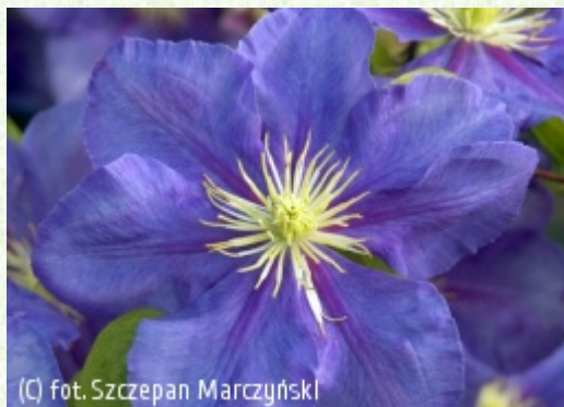
(C) fot. Szczepan Marczyński (c) fot. Szczepan Marczyński CLEMATIS Źródło Dobrych Pnączy Sp. z o.o. Spółka komandytowa

Grupa Late Large-flowered (incl. Jackmanii & Lanuginosa)