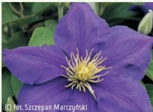
(C) fot. Szczepan Marczyński (c) fot. Szczepan Marczyński CLEMATIS Źródło Dobrych Pnączy Sp. z o.o. Spółka komandytowa