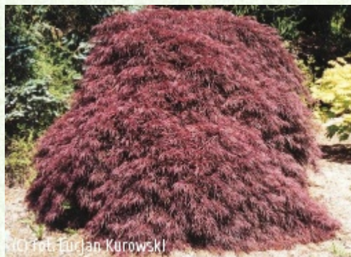
KUROWSCY Szkołki