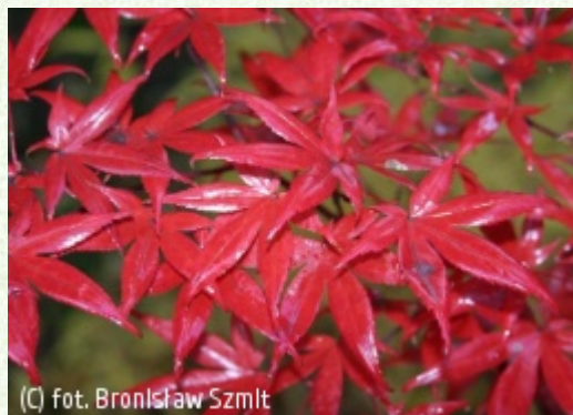
SZMIT Szkołka