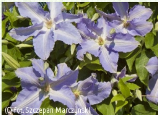
(C) fot. Szczepan Marczyński (c) fot. Szczepan Marczyński CLEMATIS Źródło Dobrych Pnączy Sp. z o.o. Spółka komandytowa