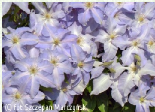
(C) fot. Szczepan Marczyński (c) fot. Szczepan Marczyński CLEMATIS Źródło Dobrych Pnączy Sp. z o.o. Spółka komandytowa

Grupa Early Large-flowered (incl. Patens, Fortunei & Florida)