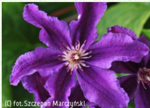
(c) fot. Szczepan Marczyński (c) fot. Szczepan Marczyński CLEMATIS Źródło Dobrych Pnączy Sp. z o.o. Spółka komandytowa

Grupa Late Large-flowered (incl. Jackmanii & Lanuginosa)