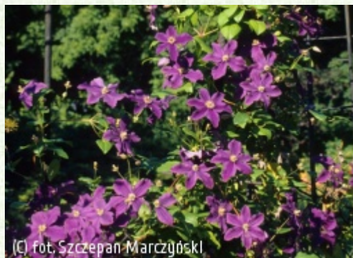
(c) fot. Szczepan Marczyński (c) fot. Szczepan Marczyński CLEMATIS Źródło Dobrych Pnączy Sp. z o.o. Spółka komandytowa

Polska odmiana o fioletowych, delikatnie cieniowanych kwiatach z szeroką, ciemniejszą pręgą przez środek działek. Kwiaty złożone z 6 działek o lekko falowanych brzegach. Pręciki mają kremowe nitki i fioletowe pylniki. Kwitnie obficie VI-VIII. Silnie rośnie, dorastając do 3-4m. Nadaje się do sadzenia przy ogrodzeniach, altanach, kratkach, tyczkach i innych podporach ogrodowych. Nadaje się do tworzenia osłon lub sadzenia przy drzewach. Szczególnie ładnie wygląda posadzona na jasnym tle.