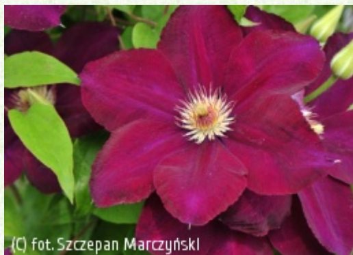
(C) fot. Szczepan Marczyński (c) fot. Szczepan Marczyński CLEMATIS Źródło Dobrych Pnączy Sp. z o.o. Spółka komandytowa

Grupa Late Large-flowered (incl. Jackmanii & Lanuginosa)