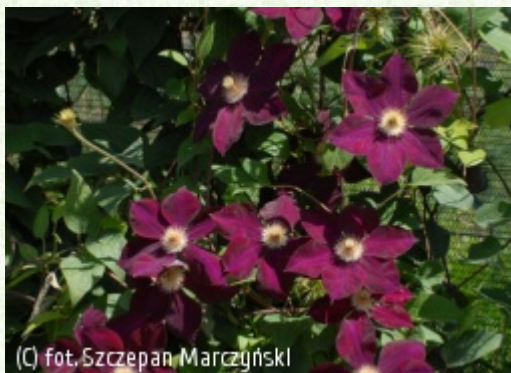
(C) fot. Szczepan Marczyński (c) fot. Szczepan Marczyński CLEMATIS Źródło Dobrych Pnączy Sp. z o.o. Spółka komandytowa