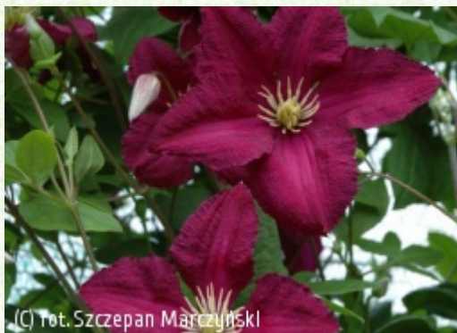
(C) fot. Szczepan Marczyński (c) fot. Szczepan Marczyński CLEMATIS Źródło Dobrych Pnączy Sp. z o.o. Spółka komandytowa