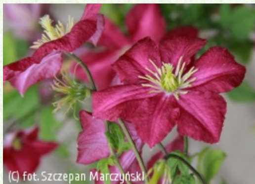
CLEMATIS Źródło Dobrych Pnączy Sp. z o.o. Spółka komandytowa