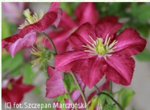
(C) fot. Szczepan Marczyński (c) fot. Szczepan Marczyński CLEMATIS Źródło Dobrych Pnączy Sp. z o.o. Spółka komandytowa