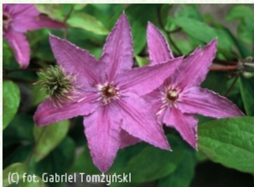
(C) fot. Gabriel Tomżyński (c) fot. Gabriel Tomżyński TOMZYNSKI Szkołka Roślin