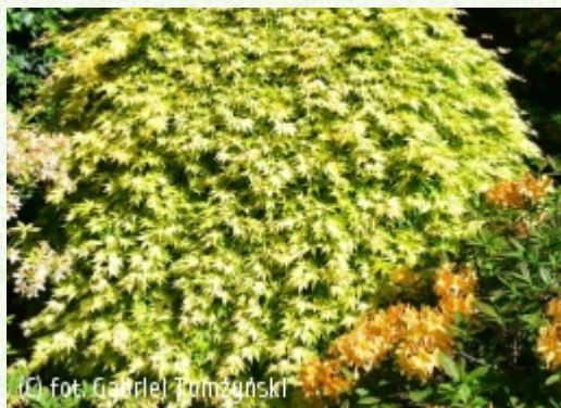
(c) fot. Gabriel Tomżyński (c) fot. Gabriel Tomżyński TOMŻYNSKI Szkołka Roślin