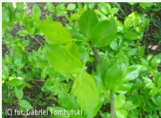
(C) fot. Gabriel Tomżyński

(c) fot. Gabriel Tomżyński TOMZYNSKI Szkołka Roślin