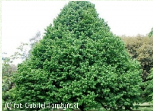
TOMŻYNSKI Szkółka Roślin