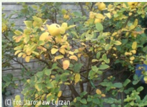
(C) fot. Jarosław Cyrzan

(c) fot. Jarosław Cyrzan CYRZAN Szkółki Drzew i Krzewów Ozdobnych