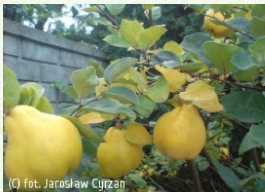
(C) fot. Jarosław Cyrzan

(c) fot. Jarosław Cyrzan CYRZAN Szkółki Drzew i Krzewów Ozdobnych