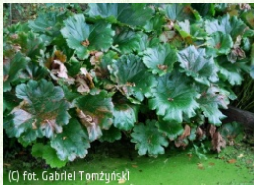
TOMŻYNSKI Szkołka Roślin