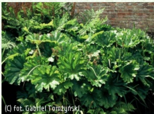
TOMŻYNSKI Szkołka Roślin