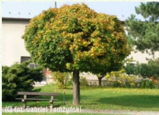
(c) fot. Gabriel Tomżyński (c) fot. Gabriel Tomżyński TOMŻYŃSKI Szkołka Roślin