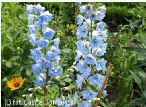
(c) fot. Gabriel Tomżyński TOMŻYŃSKI Szkółka Roślin