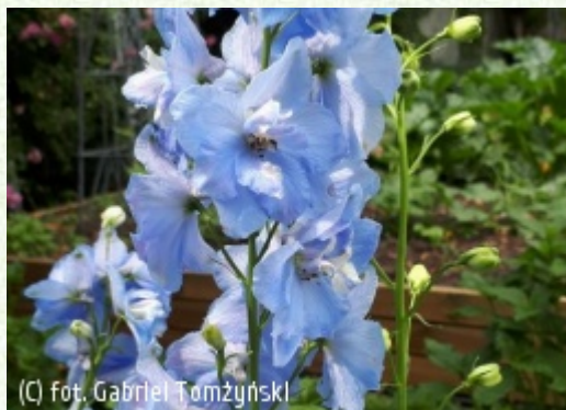
(c) fot. Gabriel Tomżyński TOMŻYŃSKI Szkółka Roślin