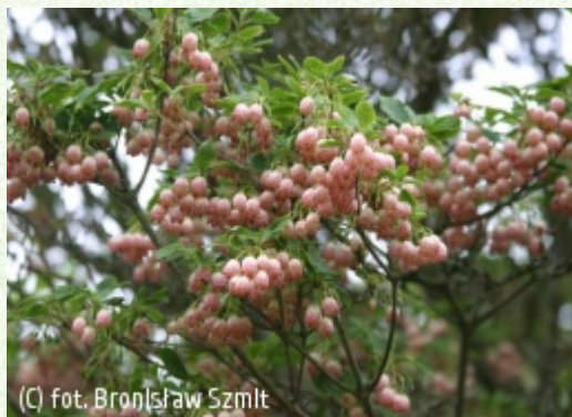
(C) fot. Bronisław Szmit (c) fot. Bronisław Szmit SZMIT Szkołka