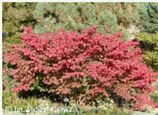
(C) fot. Andrzej Kujawa (c) fot. Andrzej Kujawa KUJAWA Andrzej Szkółka „Bąblin”