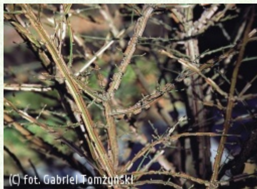
TOMŻYŃSKI Szkółka Roślin