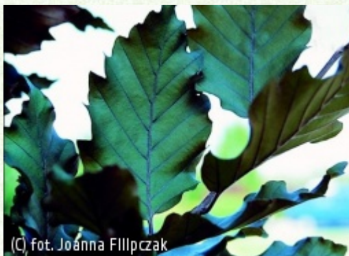
(C) fot. Joanna Fllpczak

(c) fot. Gabriel Tomżyński TOMZYŃSKI Szkołka Roślin