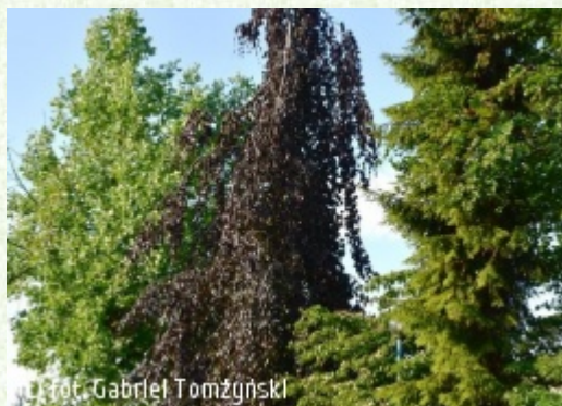
(c) fot. Gabriel Tomżyński TOMZYNSKI Szkołka Roślin