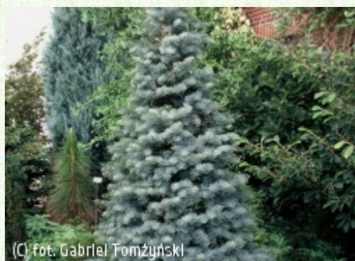
(C) fot. Gabriel Tomżyński

(c) fot. Gabriel Tomżyński TOMŻYŃSKI Szkołka Roślin