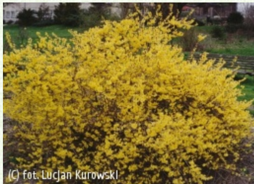
(C) fot. Lucjan Kurowski (c) fot. Lucjan Kurowski KUROWSCY Szkółki