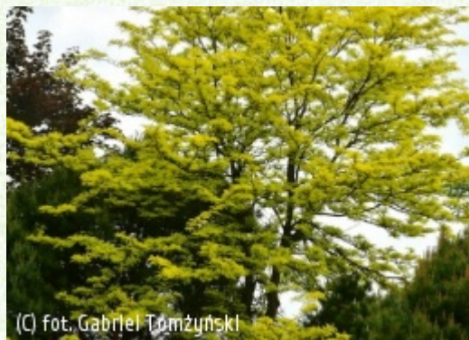
TOMZYNSKI Szkołka Roślin