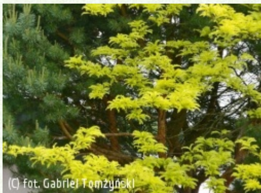
TOMZYNSKI Szkołka Roślin