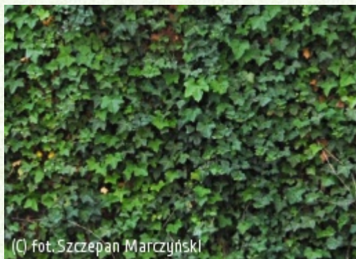
(C) fot. Szczepan Marczyński

(c) fot. Szczepan Marczyński CLEMATIS Źródło Dobrych Pnączy Sp. z o.o. Spółka komandytowa