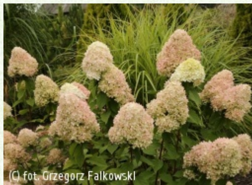
(C) fot. Grzegorz Falkowski

(c) fot. Andrzej Kujawa KUJAWA Andrzej Szkółka „Bąblin”