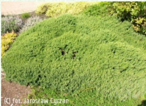
(c) fot. Jarosław Cyrzan

(c) fot. Jarosław Cyrzan CYRZAN Szkołki Drzew i Krzewów Ozdobnych