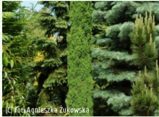
(C) fot. Agnieszka Żukowska

(c) fot. Gabriel Tomżyński TOMZYNSKI Szkołka Roślin