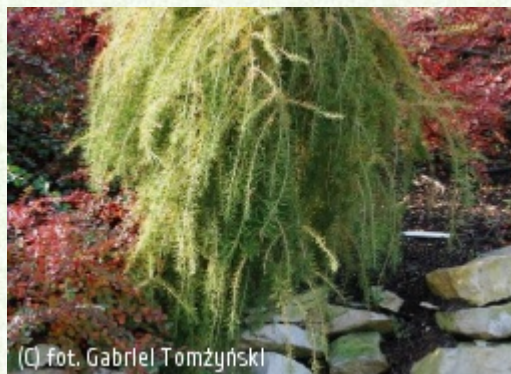
TOMŻYŃSKI Szkołka Roślin