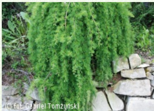
TOMŻYŃSKI Szkołka Roślin