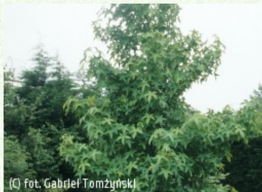
(C) fot. Gabriel Tomżyński (c) fot. Gabriel Tomżyński TOMZYNSKI Szkółka Roślin