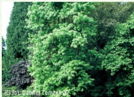
(C) fot. Gabriel Tomżyński (c) fot. Gabriel Tomżyński TOMZYNSKI Szkółka Roślin