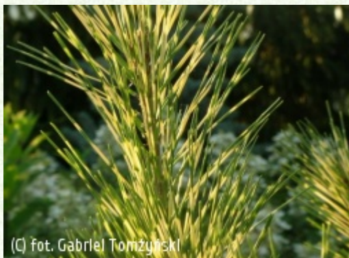
TOMŻYŃSKI Szkołka Roślin