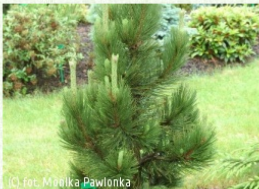
(c) fot. Małka Pawlonka

(c) fot. Gabriel Tomżyński TOMŻYŃSKI Szkołka Roślin