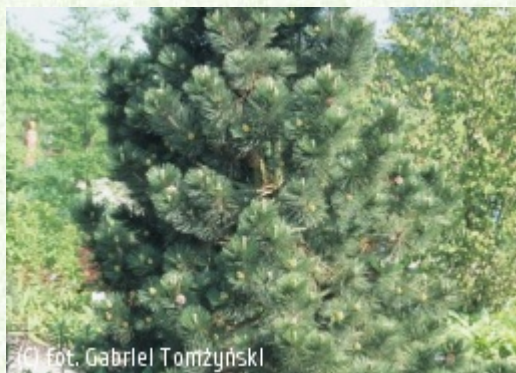
(c) fot. Gabriel Tomżyński

(c) fot. Gabriel Tomżyński TOMŻYŃSKI Szkołka Roślin