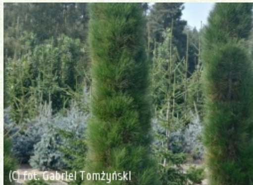
(c) fot. Gabriel Tomżyński (c) fot. Gabriel Tomżyński TOMŻYŃSKI Szkołka Roślin