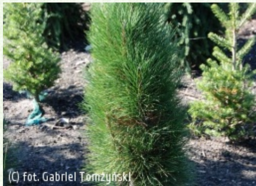
(c) fot. Gabriel Tomżyński (c) fot. Gabriel Tomżyński TOMŻYŃSKI Szkołka Roślin