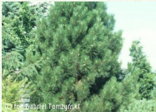
(c) fot. Gabriel Tomżyński (c) fot. Gabriel Tomżyński TOMŻYŃSKI Szkołka Roślin