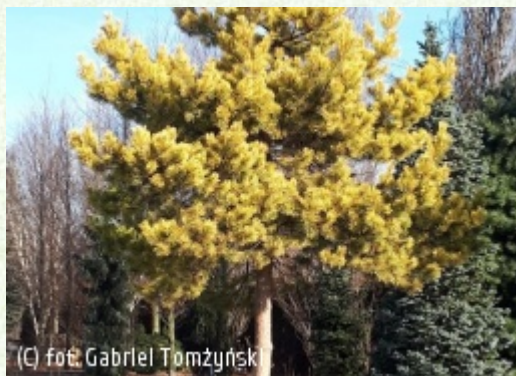
TOMŻYŃSKI Szkołka Roślin