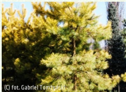
TOMŻYŃSKI Szkołka Roślin