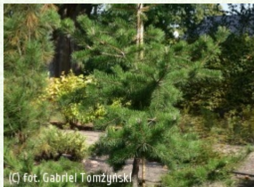
(c) fot. Gabriel Tomżyński (c) fot. Gabriel Tomżyński TOMŻYŃSKI Szkółka Roślin