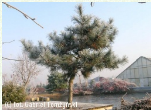
(c) fot. Gabriel Tomżyński (c) fot. Gabriel Tomżyński TOMŻYŃSKI Szkółka Roślin