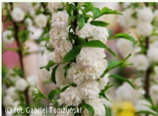
TOMŻYŃSKI Szkołka Roślin