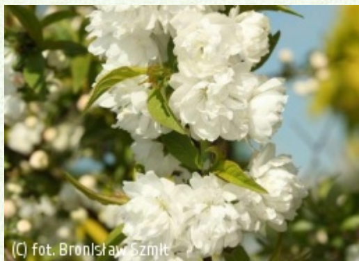
(C) fot. Bronisław Szmit (c) fot. Bronisław Szmit SZMIT Szkołka