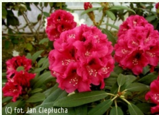
(C) fot. Jan Cieplucha

(c) fot. Jan Cieplucha CIEPŁUCHA Gospodarstwo Szkołkarskie