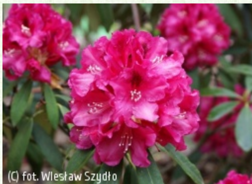
(C) fot. Wiesław Szydło

(c) fot. Jan Cieplucha CIEPŁUCHA Gospodarstwo Szkołkarskie