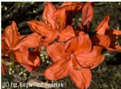
(C) fot. Eugeniusz Pudełek

(c) fot. Eugeniusz Pudełek PUDEŁEK Eugeniusz Szkołka Krzewów Ozdobnych