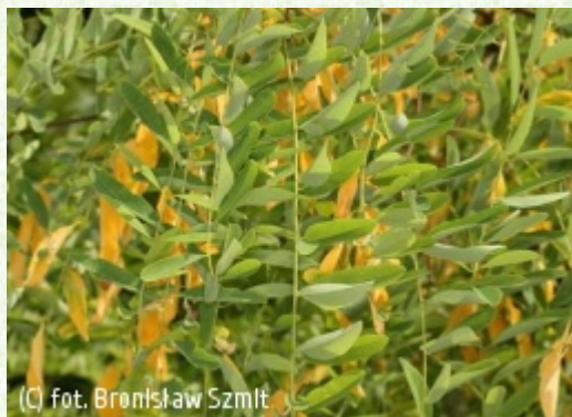
SZMIT Szkółka

Synonim pol.: grochodrzew biały 'Rozynskiana'