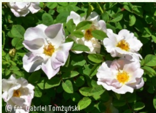
(C) fot. Gabriel Tomżyński

(c) fot. Gabriel Tomżyński TOMŻYŃSKI Szkołka Roślin