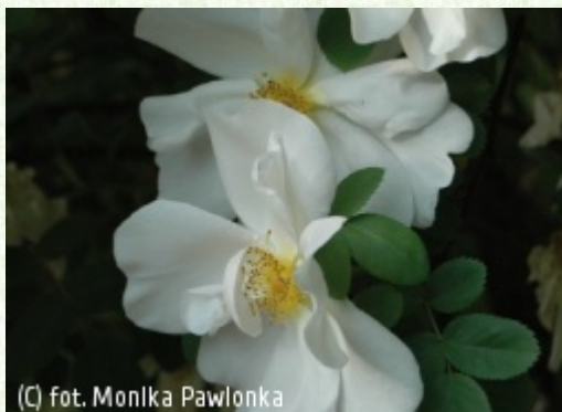
(C) fot. Monika Pawlonka

(c) fot. Gabriel Tomżyński TOMŻYŃSKI Szkołka Roślin