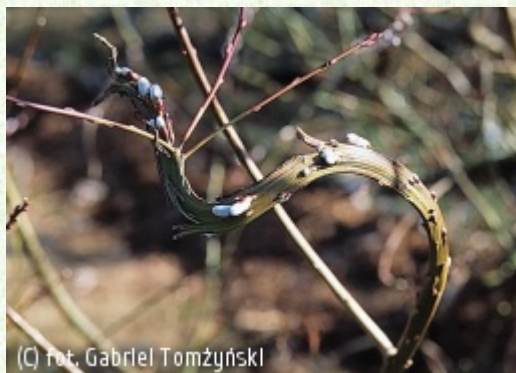
(C) fot. Gabriel Tomżyński

(c) fot. Gabriel Tomżyński TOMŻYŃSKI Szkołka Roślin