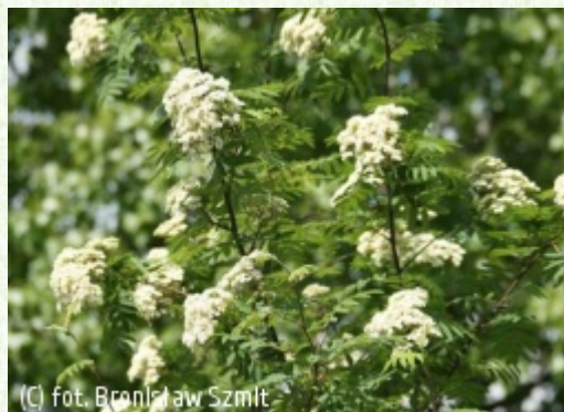
SZMIT Szkołka