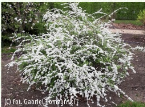
TOMŻYŃSKI Szkółka Roślin